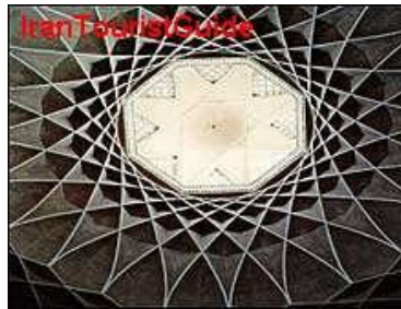
شکل ۲-۱: یک اثر معماری؛ منبع:

برای نشان دادن یک دستگاه، شیء یا رویداد، تنها از عکس می‌توان کمک گرفت. هرگاه جزء خاصی از عکس مورد نظر است، باید به‌گونه‌ای تهیه شود که اجزای فرعی چشمگیرتر از جزء مورد نظر نباشد. (شکل ۲-۱)