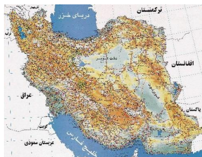
نقشه ۲-۲: نقشه ایران؛ منبع:

باید تا حد امکان از به‌کاربردن صفحه‌های بزرگ مانند نقشه‌ها در پایان‌نامه خودداری شود و آنها را از طریق رونوشت‌های (فتوکپی‌های) مخصوص در اندازه تعیین شده تهیه کرد. در صورت لزوم باید به دقت مورد نظر را داخل پایان‌نامه طوری تا نمود که لبه آن از دیگر صفحه‌ها بیرون نزنند.