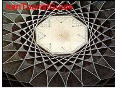
شکل ۲-۱: یک اثر معماری

برای نشان دادن یک دستگاه، شیء یا رویداد، تنها از عکس می‌توان کمک گرفت. هرگاه جزء خاصی از عکس مورد نظر است، باید به گونه‌ای تهیه شود که اجزای فرعی چشمگیرتر از جزء مورد نظر نباشد. (شکل ۲-۱)