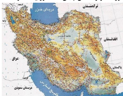
نقشه ۲-۲: نقشه ایران؛ منبع:

باید تا حد امکان از به‌کاربردن صفحه‌های بزرگ مانند نقشه‌ها در پایان‌نامه خودداری شود و آنها را از طریق رونوشت‌های (فتوکپی‌های) مخصوص در اندازه تعیین شده تهیه کرد. در صورت لزوم باید به دقت صفحه مورد نظر را داخل پایان‌نامه طوری تا نمود که لبه آن از دیگر صفحه‌ها بیرون نزنند.