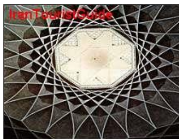
شکل ۲-۱: یک اثر معماری

برای نشان دادن یک دستگاه، شیء یا رویداد، تنها از عکس می‌توان کمک گرفت. هرگاه جزء خاصی از عکس مورد نظر است، باید به گونه‌ای تهیه شود که اجزای فرعی چشمگیرتر از جزء مورد نظر نباشد. (شکل ۲-۱)