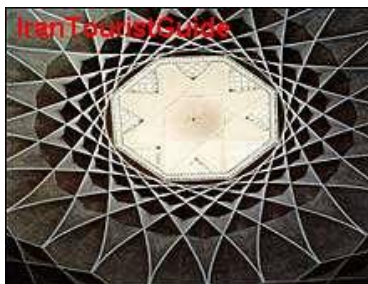
شکل ۲-۱: یک اثر معماری؛ منبع: